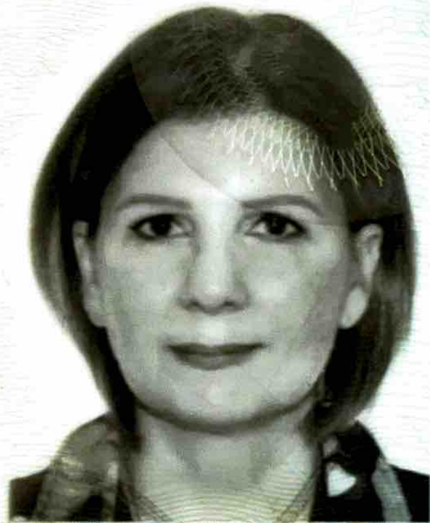
PENNISANTONELLA MARIA SANTA CA03814SR PENNISIANTONELLA MARIA SANTA CA03814SR PENNISIANTONELLA MARIA SANTA CA03814SR